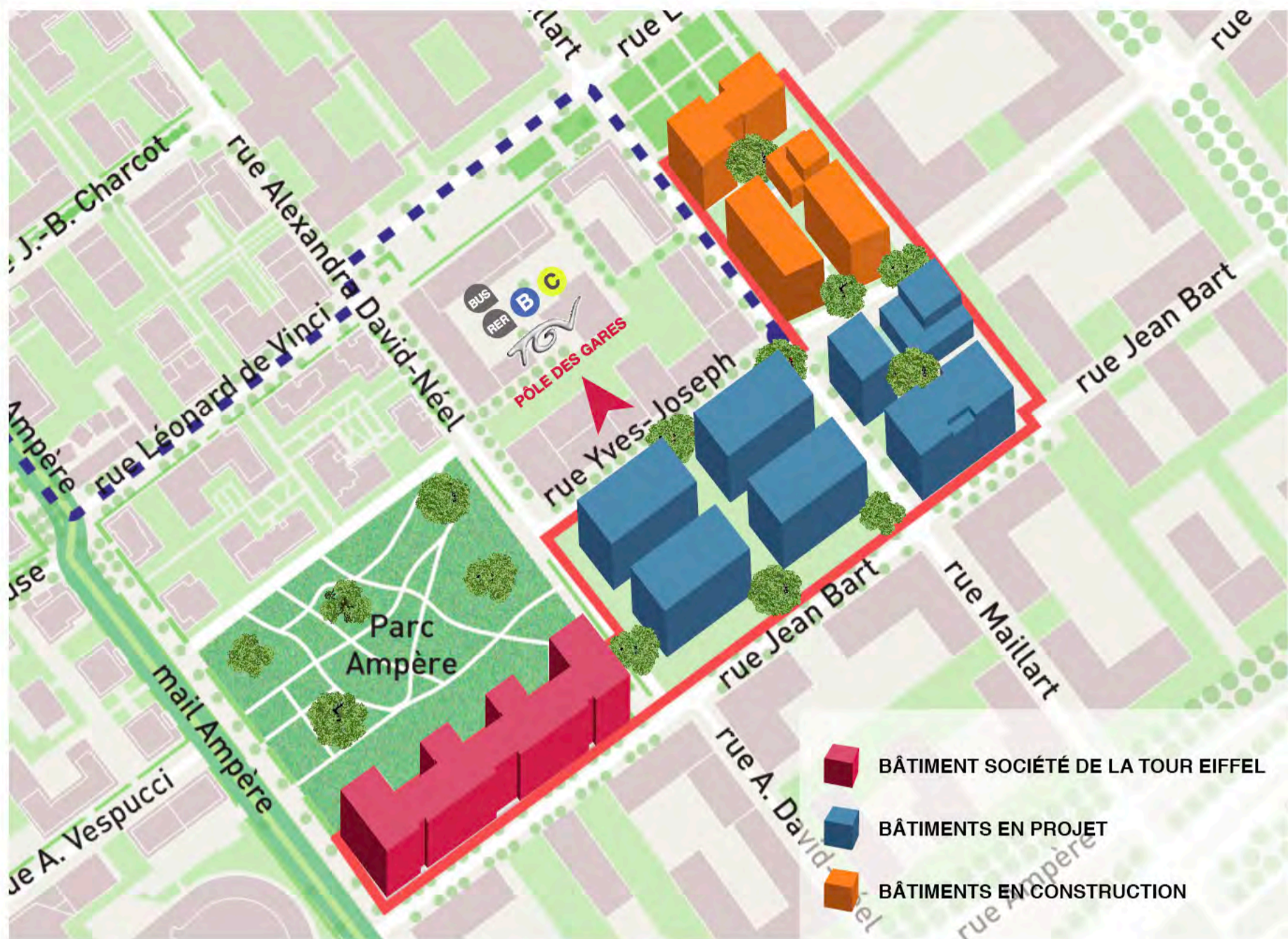
Tableau des surfaces par bâtiment